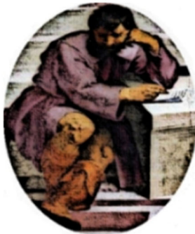
Imagen 10. Heráclito