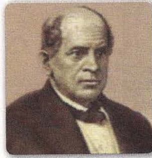
DOMINGO FAUSTINO SARMIENTO