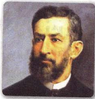
JUAN LEÓN MERA