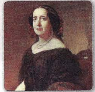
GERTRUDIS GÓMEZ DE AVELLANEDA